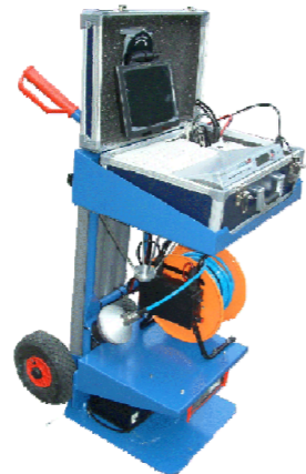
Monitor op steekwagen