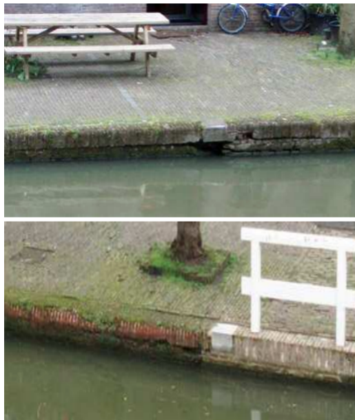
Schade aan Utrechtse werfkades

De eeuwenoude Utrechtse werfkelders zijn vanaf ca. 1950 grootscheeps gerestaureerd en waterdicht gemaakt. Sindsdien zijn ze commercieel in gebruik en een belangrijke toeristische attractie geworden. Er dreigt echter gevaar, nu van onder de waterlijn.